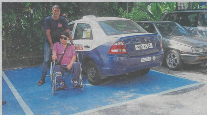
A patient using the OKU parking bay near Kurnia Dialysis Centre in Kampung Sungai Kayu Ara, Petaling Jaya.

"However, the council will review the situation in that local