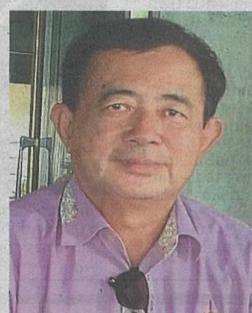
Tai suggests the landowners make a police report so that authorities can take action against the culprits of illegal dumping.

“It is the responsibility of landowners to safeguard the boundaries and interests of their land. On the issue of rubbish dumping here, PTD Sepang will carry out its own investigation.