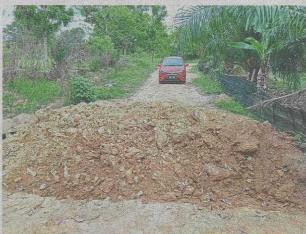
One landowner has built a low wall of earth to stop illegal dumpers from trespassing the land in Sungai Pelek.